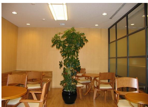
リフレッシュルーム(5F)