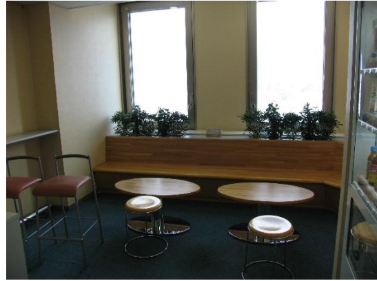
リフレッシュルーム(2・7F)