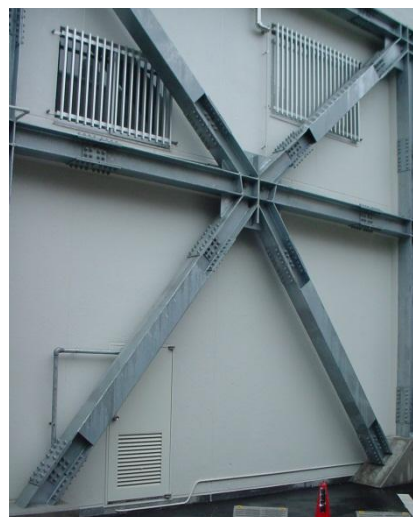
外観 耐震工事（裏面）